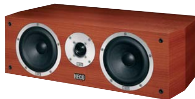
METAS Center 3 -Kirsche/cherry-