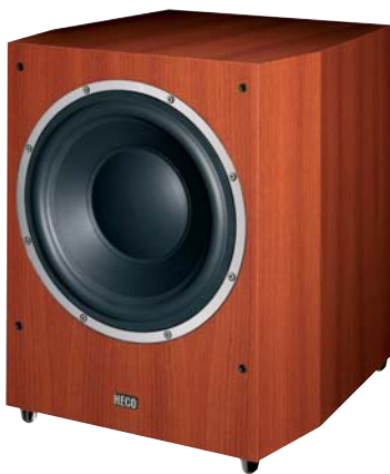
METAS Sub 30 A -Kirsche/cherry-