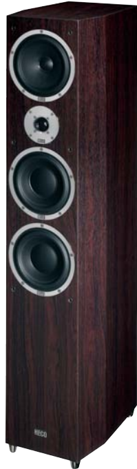
METAS 700 -Rosewood Exclusive-