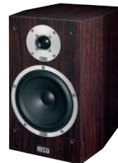
METAS 300 -Rosewood Exclusive-