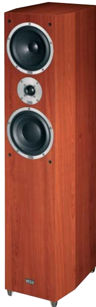
METAS 500 -Kirsche/cherry-